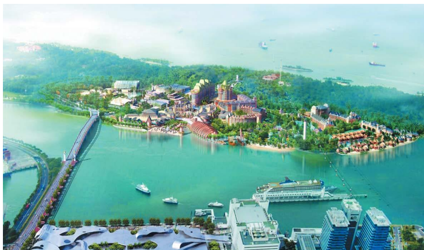
北京京冶工程有限公司承建的圣淘沙综合娱乐设施项目（部分）

新加坡对华投资主要项目包括：中新三个政府间合作项目苏州工业园区、天津生态城、中新（重庆）战略性互联互通示范项目，以及广州知识城、吉林食品区、新川科技创新园、南京生态科技岛等。