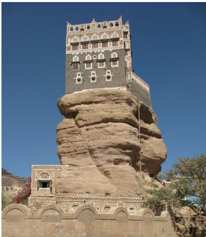
叶海亚王宫（又称石头宫）

也门是阿拉伯半岛人口最多的国家，世界银行数据显示，截至2019年底，也门人口约2916.2万人，增长率为2.3%；城市人口和农村人口分别占总人口的36.64%和63.36%；城市人口和农村人口增长率分别为4.1%和1.37%。2019年，首都萨那人口287.4万人，占也门城市人口的26.4%。除首都萨那外，人口集中的省份还有亚丁、塔兹、荷台达和伊卜。