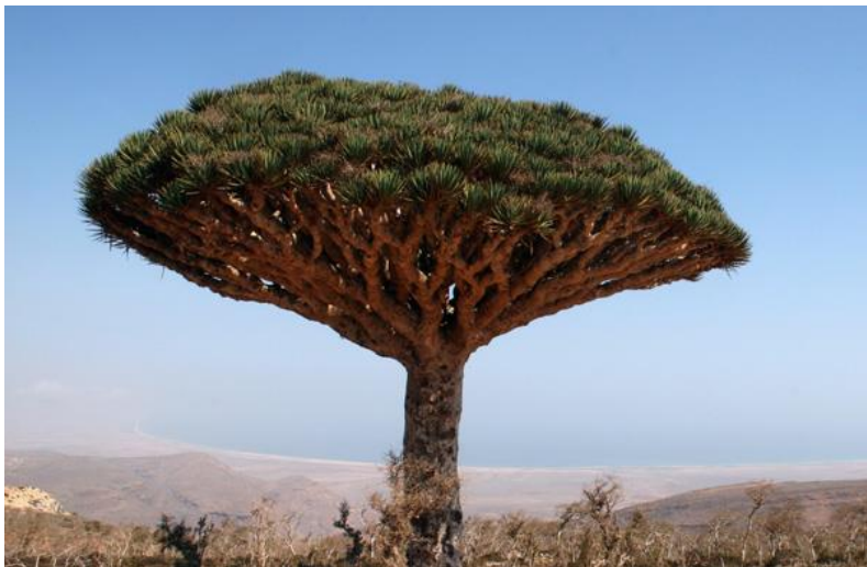
索科特拉岛特有树种——龙血树

也门有悠久的古代文明、丰富的文化遗产和杰出的建筑作品。据联合国教科文组织统计，也门有索科特拉岛等四处古迹或景区被列为世界文化遗产。“四五”规划将旅游业对GDP的贡献率从3.5%上调到4.75%，目标是吸引更多海湾国家的游客。政府将投入540万美元用于解决安全方面的问题。