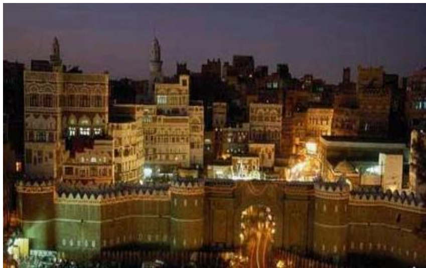
萨那老城（又称也门门）

也门水资源紧缺，主要依靠地下水。近年来，一些地方由于过度开采地下水，水资源紧张的趋势进一步加剧。