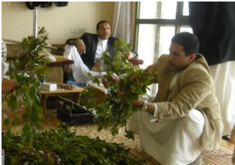
也门人日常生活中的“卡特”聚会