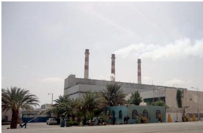
亚丁自由区发电厂