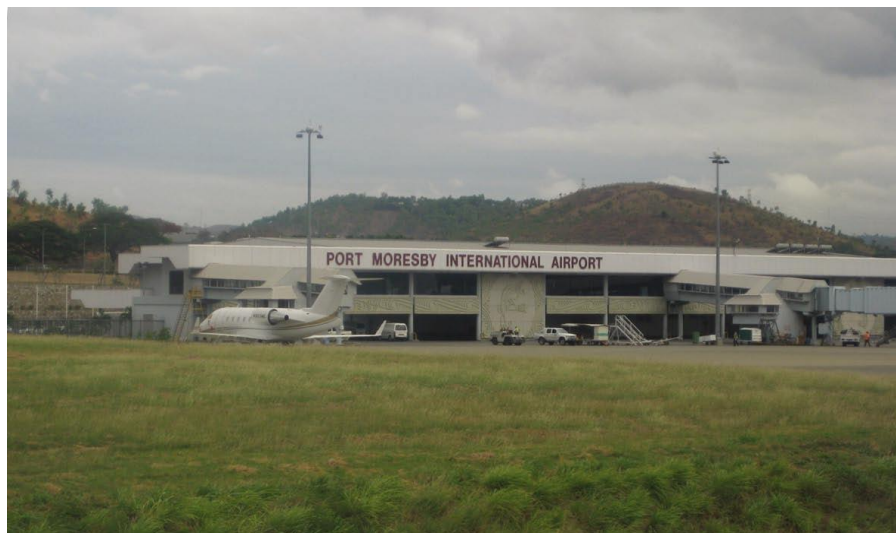
首都莫尔兹比港国际机场

中国大陆去往巴新的旅客主要经中国香港、新加坡、马尼拉、悉尼、布里斯班转机。莫尔兹比港与香港的往返航班每周三次，与新加坡间的往返航班每周五次。