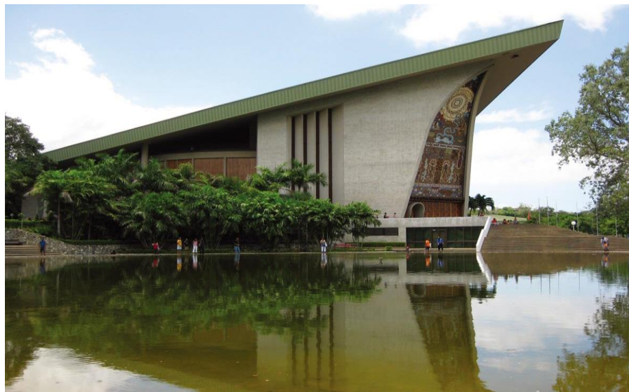
巴新标志性建筑——议会大厦

【司法】巴新司法部门独立行使权力，包括法院，最高法院、国家法院和地方法院三个层级。最高法院对其他各类司法机构具有上诉管辖权，并对解释和运用宪法法律条款拥有司法权。现任首席大法官为吉布斯·萨力克爵士（Sir Gibbs Salika）。