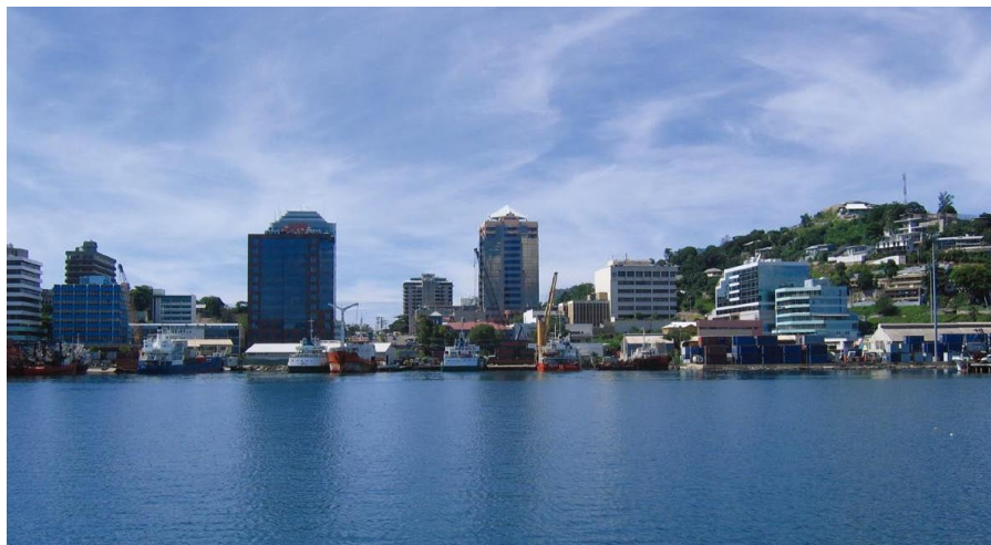
首都莫尔兹比港港口