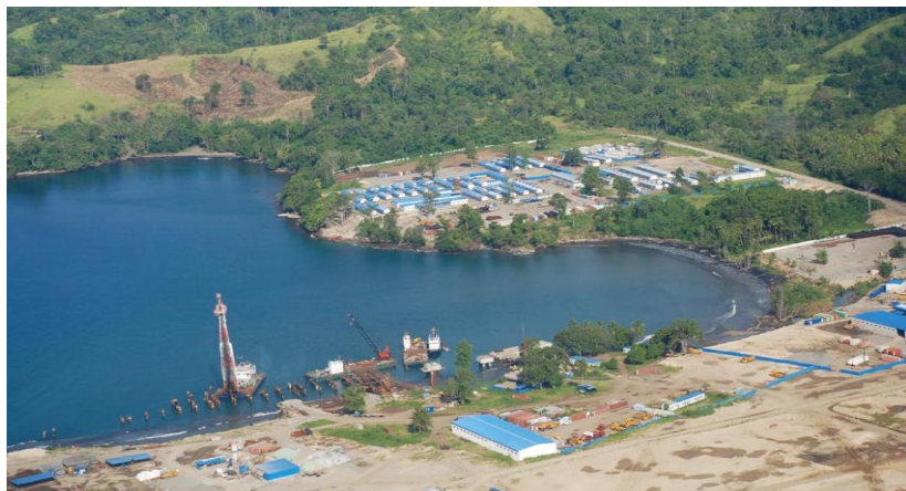
未瑞木镍钴矿项目现场

巴新经济支柱产业为矿产和石油、农业、林业、渔业等。主要出口产品有液化天然气、黄金、铜、银、原油、镍钴、木材和棕榈油、咖啡、可可。