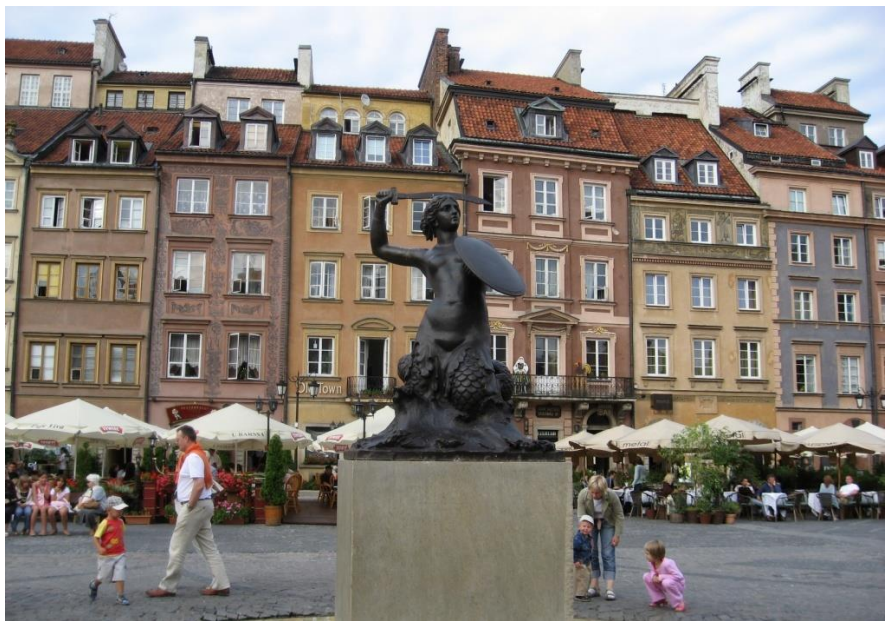
华沙老城广场美人鱼雕像

2019年4月，波兰全国约80%的中小学和幼儿园教师因薪资问题举行罢工，要求政府提高教师收入。