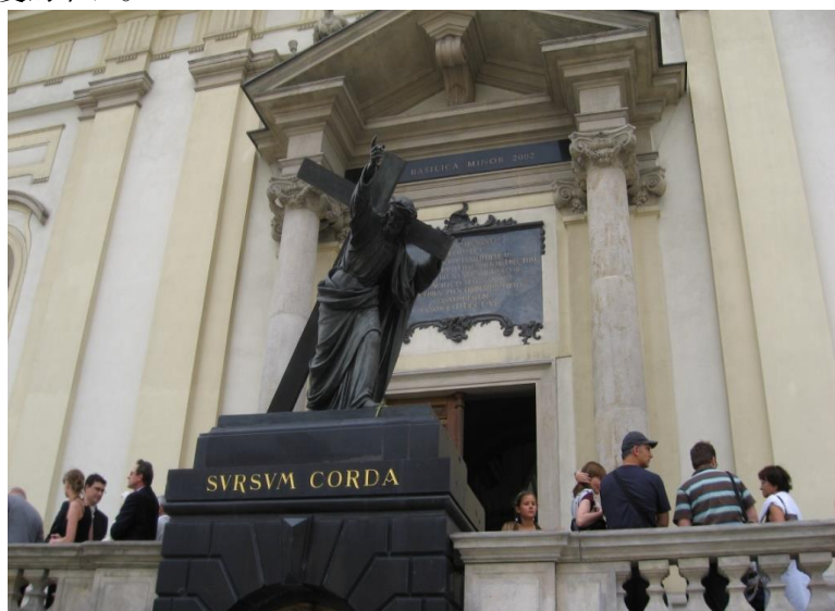
藏有肖邦心脏的圣十字教堂

90%的波兰人信仰罗马天主教，少部分信仰东正教或基督教新教。教会在波兰影响力很大，前罗马教皇约翰·保罗二世被波兰人视为民族骄傲，2014年4月保罗二世被罗马教廷认定为“圣人”。圣诞节是波兰人最重要、最喜爱的节日。