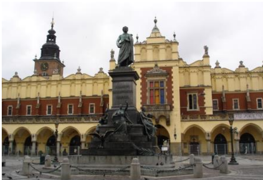
克拉科夫市老城广场

岸维斯瓦河的入海口，人口约58.2万（2017年），是波兰北部最大的城市，与索波特、格丁尼亚两市形成庞大的港口城市联合体——三联轴。其他重要城市还有罗兹、卡托维茨、波兹南等。