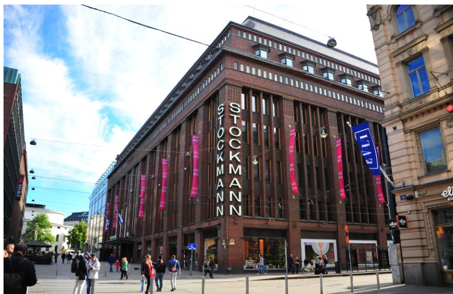
斯托克曼百货商店

2018年9月起,芬兰最大的百货公司斯托克曼(Stockmann)正式推出支付宝作为支付方式。目前,支付宝已在芬兰多个购物中心和商店得到广泛应用。