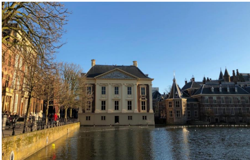
海牙莫里茨博物馆

荷兰1463年正式成为国家，16世纪前长期处于封建割据状态。16世纪初受西班牙统治，1568年爆发延续80年的反抗西班牙统治的战争。1581年北部七省成立荷兰共和国（正式名称为尼德兰联省共和国）。1648年《威斯特伐利亚和约》的签署使西班牙正式承认荷兰独立。17世纪成为海上殖民强国，经济、文化、艺术、科技等各方面均非常发达，被誉为该国的“黄金时代”。18世纪后，殖民体系逐渐瓦解，国势渐衰。1795年法军入侵，1810年并入法国，1814年脱离法国，翌年成立荷兰王国（1830年比利时脱离荷兰独立）。1848年成为君主立宪国。第一次世界大战期间保持中立。第二次世界大战初期，荷兰宣布中立。1940年5月被德国军队侵占，王室和政府迁至英国，成立流亡政府。1945年恢复独立，战后放弃中立政策，加入北约和欧共体及后来的欧盟。