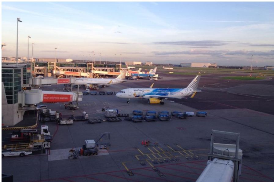
阿姆斯特丹史基浦机场

阿姆斯特丹史基浦国际机场多年来一直是欧洲四大航空枢纽之一，已经与近100个国家的332个机场间建立了直航。2019年运送旅客7170万人次，位列欧洲第三，货物吞吐量157万吨，位列欧洲第四。