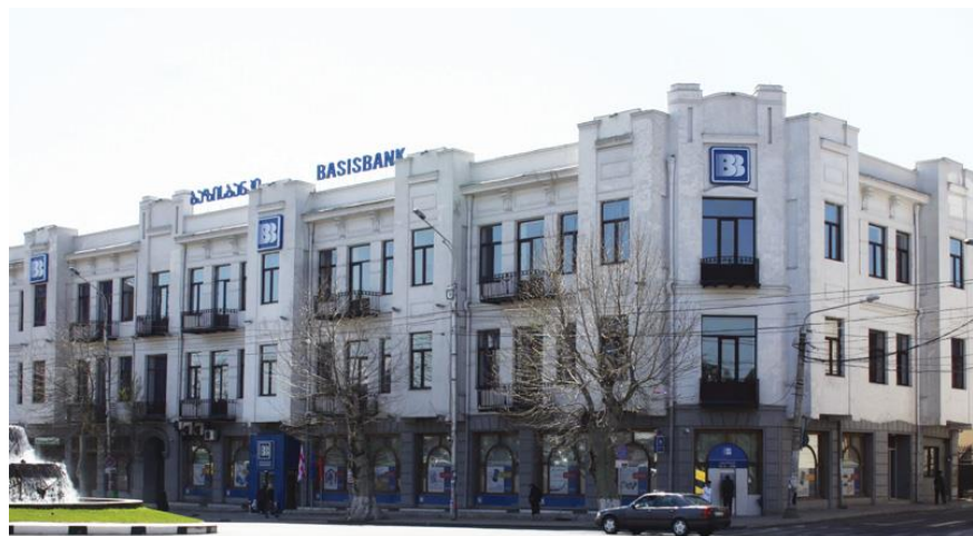
新疆华凌集团收购的基础银行

2020年3月31日，格鲁吉亚中央银行公布的美元兑拉里中间价是3.2845，欧元兑拉里中间价是3.6363。