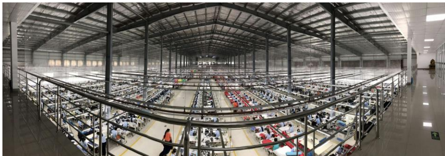
中资在缅纺织制衣厂

【能源】截至2018年过渡财年末，外国企业在缅甸石油和天然气领域投资留存项目88个，投资额185.45亿美元，占外商在缅甸投资的29.2%。据缅甸商务部统计，2018年过渡财年，缅甸天然气出口额11.7亿美金，约占缅甸出口总额的13.2%。中国石油（CNPC）、北方石油（NORTH PETRO）以及泰国的（PTTEPI）、韩国的大宇（DAEWOO）、法国的道达尔（TOTAL）、越南石油（PETRO VIETNAM）等公司都已与缅甸签署油气勘探开发区块协议。