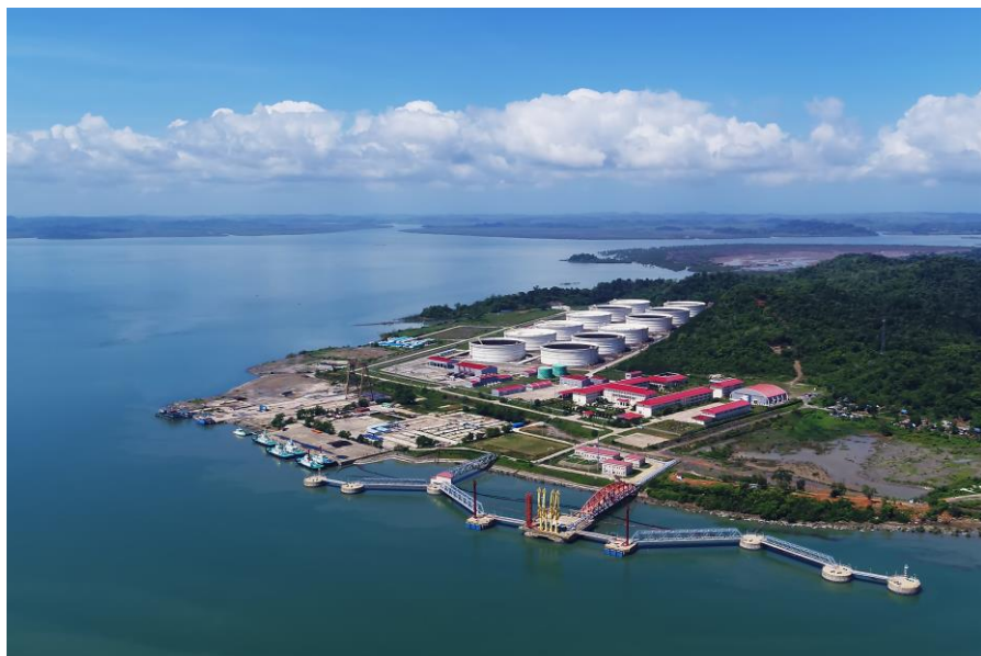
中缅油气管道马德岛港

【承包工程】据中国商务部统计，2019年中国企业在缅甸新签承包工程合同129份，新签合同额63.07亿美元，完成营业额18.63亿美元。累计派出各类劳务人员4061人，年末在缅甸劳务人员4745人。新签大型承包工程项目包括中兴通讯股份有限公司承建2018-2019年缅甸MPT JO运维服务产品竞标项目；中铁国际集团有限公司承建缅甸曼德勒产业新城基础设施项目；中国建筑集团有限公司承建缅甸仰光新天地项目（中南）等。