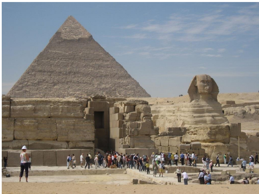
金字塔和狮身人面像

埃及是世界四大文明古国之一。公元前3200年，美尼斯统一埃及建立了第一个奴隶制国家，此后经历了早王国、古王国、中王国、新王国和后王朝时期，共30个王朝。古王国开始大规模建金字塔。中王国经济发展、文艺复兴。新王国生产力显著提高，开始对外扩张，成为军事帝国。后王朝时期，内乱频繁，外患不断，国力日衰。公元前525年，埃及成为波斯帝国的一个行省。在此后的一千多年间，埃及相继被希腊和罗马征服。公元641年，阿拉伯人入侵，埃及逐渐阿拉伯化，成为伊斯兰教一个重要中心。1517年被土耳其人征服，成为奥斯曼帝国的行省。1882年被英军占领后成为英国“保护国”。