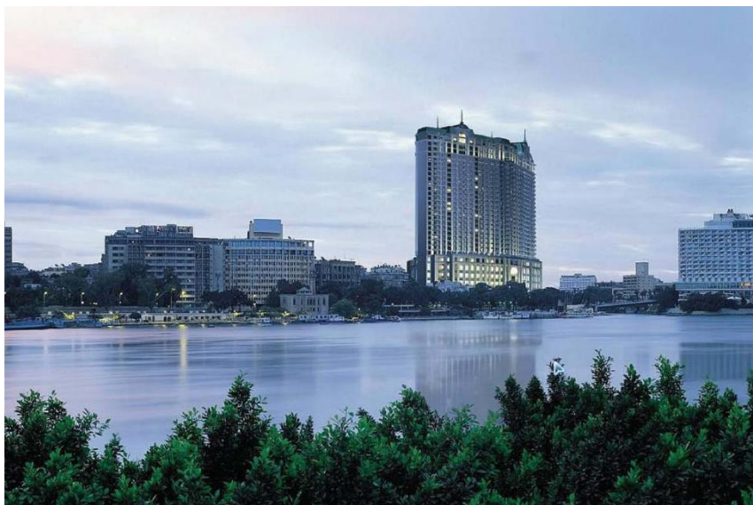
标志性建筑——开罗四季酒店