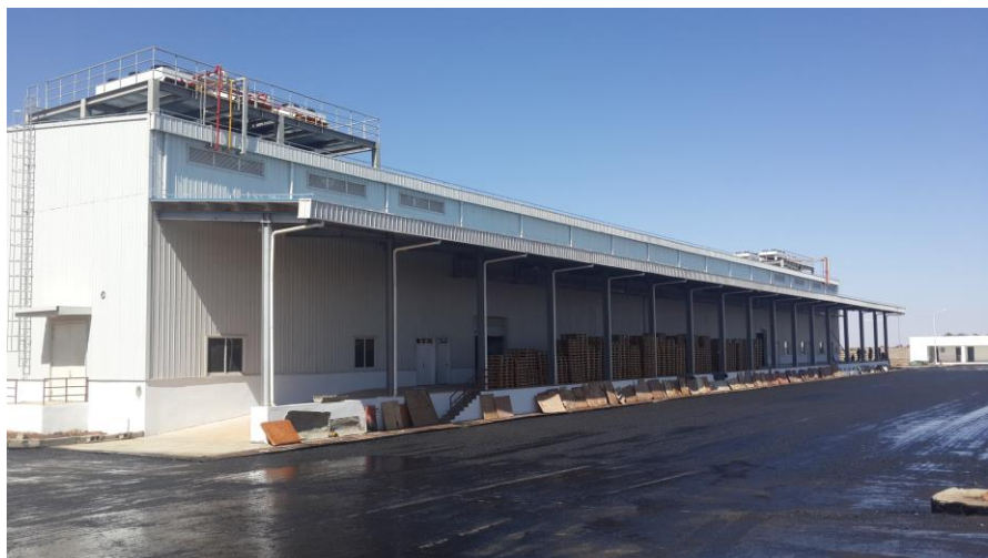
上海外经实施的涉农冷库

(1) 上海外经集团以8000万美元成功收购了厄特第二大矿---ZARA金矿60%的股权。该矿探明黄金储量73至84万盎司，开采期7年。上海外经集团同厄特国家矿业公司组成合资公司，分别占60%和40%股份，并于2015年12月开始投产，目前项目运营情况良好。