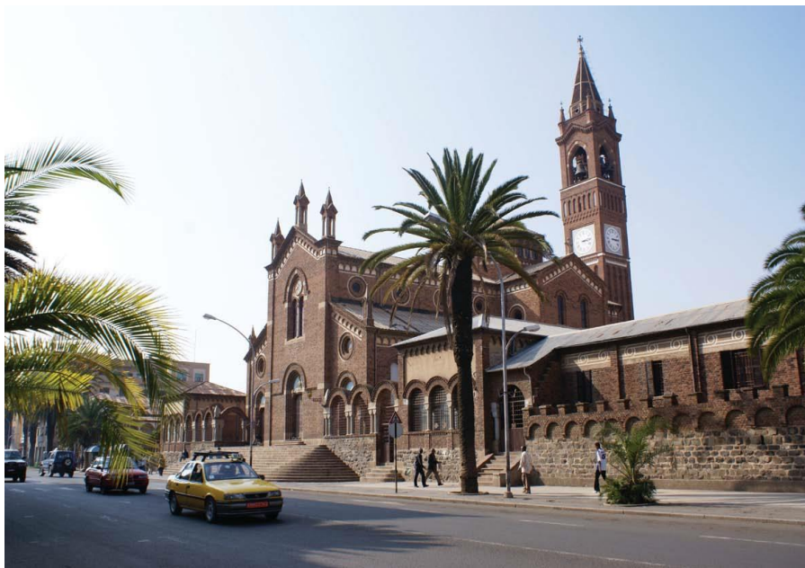
阿斯马拉主街上的天主教堂

厄立特里亚没有法定的官方语言。厄立特里亚宪法强调各民族语言的平等性，各民族语言可平等地应用在教育、媒体和日常活动中。国内各民族使用自己的语言。全国有9种民族语言，但主要是提格雷尼亚语，通用英语、阿拉伯语。有四分之三的人口使用提格雷尼亚语和提格里语。高原地区的居民大多使用提格雷尼亚语，大部分穆斯林则使用提格里语。由于厄特历史上长期受到阿拉伯世界、意大利和英国的影响，作为外来语的阿拉伯语、英语同提格雷尼亚语一样通用。英语在外交和经济活动中被广泛使用，阿拉伯语在小学课程中普及，从中学课程起全部用英语讲授。此外，由于意大利的传统殖民和影响，意大利语在首都也比较流行。厄立特里亚政府期望通过保护和强化母语教育加强民族团结、保存文化遗产。