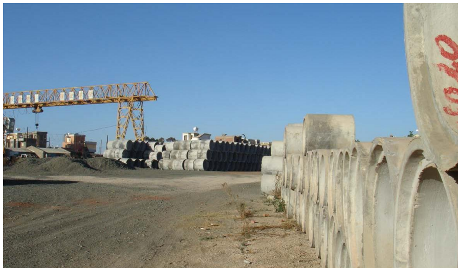
厄特中资企业——四川路桥公司施工现场

(7) 2018年9月，紫金矿业公司与加拿大Nevsun公司签署《收购执行协议》，向Nevsun公司发出100%股权现金要约收购。Nevsun公司旗下拥有厄特碧沙金铜锌矿、塞尔维亚Timok铜金矿两个旗舰项目和多个探矿项目。2018年12月，紫金矿业公司正式收购Nevsun公司全部股权，目前项目运营情况良好。