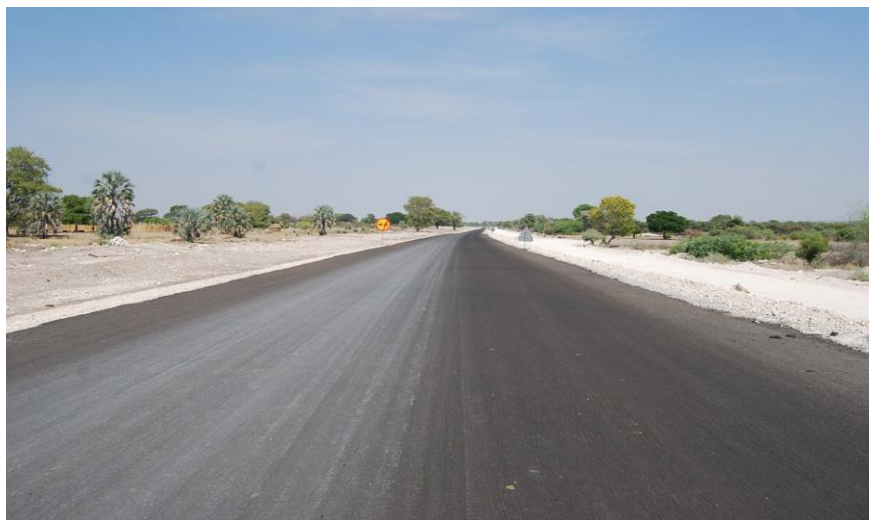
河南国际公司承建的北部公路项目现场

根据世界经济论坛竞争力报告，纳米比亚公路网位居世界前列，非洲第一。纳米比亚道路基金管理局表示已投资超过1010亿纳元将本国公路网扩展了近48000公里，未来还将投入180亿纳元用于公路网建设。