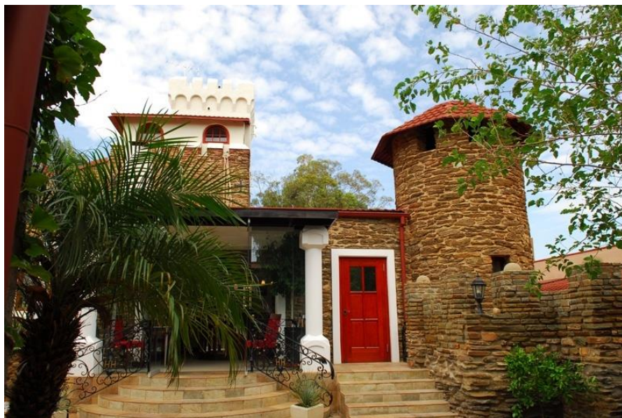
温得和克的城堡餐厅

截至2020年4月,在纳米比亚约华人3500人,其中华侨主要来自福建、辽宁、江苏、山东等省,中资企业员工及劳务主要来自北京、河南、江苏、江西和山东。集中分布于温得和克、斯瓦科普蒙德和奥西坎泽。