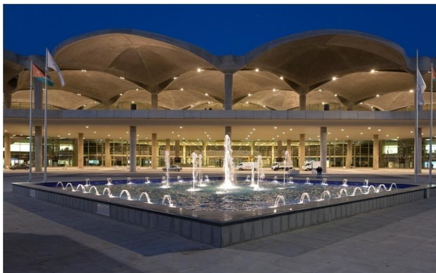
约旦安曼阿丽娅王后国际机场

约旦主要有3大机场：位于安曼的阿丽娅王后国际机场（QAIA）、安曼马尔卡国际机场（AMIA）和亚喀巴国际机场（AIA）。根据阿丽娅王后国际机场数据，2019年旅客吞吐量达892.4万人次，同比增长5.9%。飞机起降79740架次，增长3.7%。货运吞吐量达10.2万吨，下降1.6%。