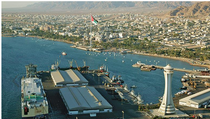
约旦亚喀巴集装箱港口

亚喀巴港是约旦唯一的港口，也是进出口贸易集散中心，拥有集装箱码头和散装码头，设置31个深水泊位，固定航线29条。港口配套有酒店、医院、购物中心等设施。根据约旦货运联盟数据，2019年，亚喀巴港口货物吞吐量为1572.64万吨，进出船只2097艘，接待游客44.06万人次。